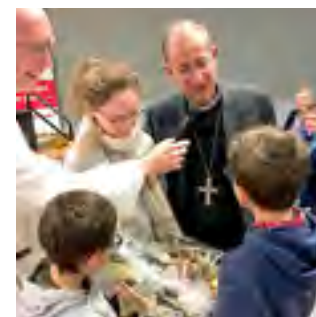
Janvier 2020 6 célébrations locales de vœux avec notre évêque, 2 ème rapport d'étape