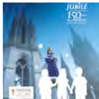
17 janvier 2018 une prière pour nous accompagner : Pèlerins et apôtres de la joie