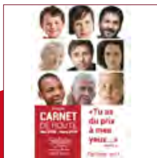
1 er carnet de route - 2019 pour préparer la 1 ère assemblée synodale délibérative