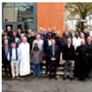
5 avril 2017 vote du conseil presbytéral