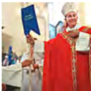
19 mai 2018 ouverture dans toutes les communautés le dimanche de Pentecôte