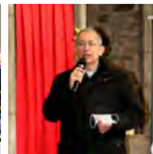
Février et mars 2021 9 rencontres locales avec notre évêque