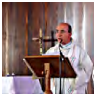
18 novembre 2017 le chancelier lit le décret de convocation