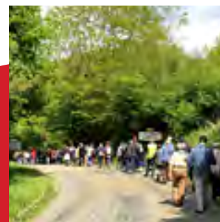
Mai et juin 2019 4 marches synodales, 1 er rapport d'étape