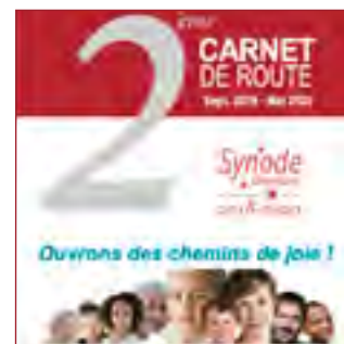
2 ème carnet de route - 2020 pour préparer la 2 ème assemblée synodale délibérative