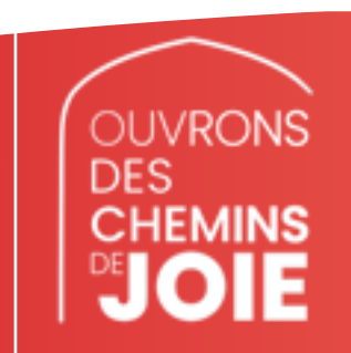
Pentecôte 23 mai 2021 promulgation des Lois et Décrets synodaux