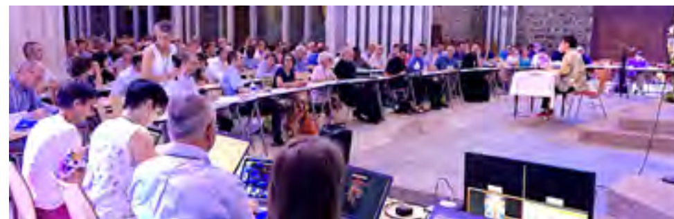
Assemblée synodale 155 personnes réunies à Pontmain 1 ère session : 25 et 26 janvier 2019 2 ème session : 5, 6 et 7 juillet 2019 3 ème session : 28, 29 février et 1 er mars 2020